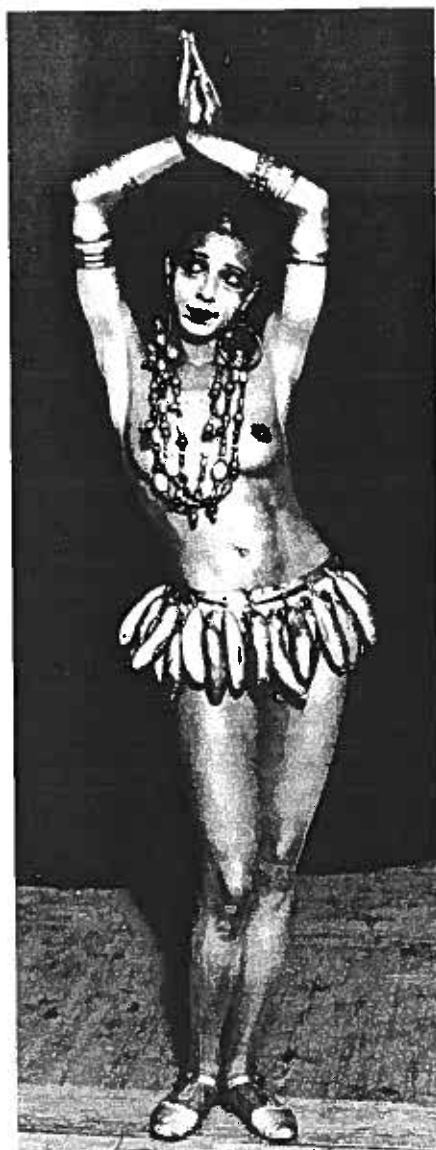
Josephine Baker, som dansede med „bananskørt“ og nøgne bryster, blev hurtigt populær hos et europæisk publikum i 1920'erne. Hun repræsenterede på én gang to hvide forhold om afrikanerne: Deres seksuelle frigjorthed og deres barnlige sind.

I Indien blev det dog fra 1860'erne stadig mere pinligt for en engelsk embedsmand at leve som den foregående generation, med en del af huset afsat til en indisk elskerinde. Bedre kommunikation med England og flere hvide kvinders nærvær førte til en svækket identifikation med det lokale samfund og kan forklare holdningsændringen.