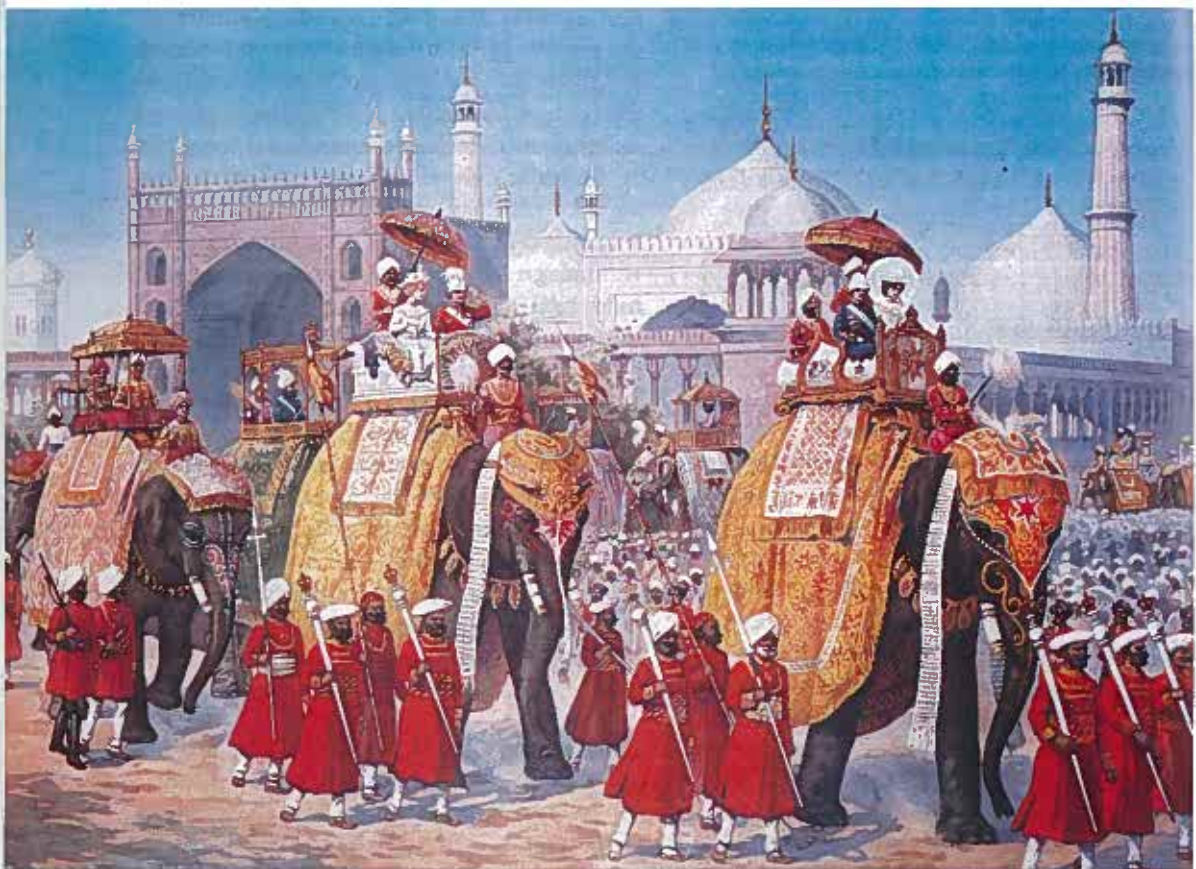
Fig. 42. Således førte lord Curson sig frem i 1903. Den engelske vicekonge af Indien og hans hustrus på den forreste elefant.

beundring, snart i forbløffelse, oftere i vrede og i smerte, indtil det endelig er blevet vanskeligt at fatte, at der virkelig er sket en forandring. For at finde en parallel til et sådant styre tror jeg, at vi skal tilbage til Aurangzebs (se s. 117) tid i vort lands historie. Der finder vi det samme eksempel på et styre, der var overdrevent centraliseret og intenst personligt, den samme anstrengte målrettethed, den samme alt dominerende pligtfølelse, den samme beundringsværdige arbejdsevne, den samme følelse af ensomhed, den samme holden fast ved en politik præget af mistænksomhed og undertrykkelse, som resulterede i en generel forbitrelse. Jeg tror, at selv den varmeste beundrer af Lord Curson ikke kan påstå, at han har styrket grundlaget for det engelske styre i Indien... For ham var Indien