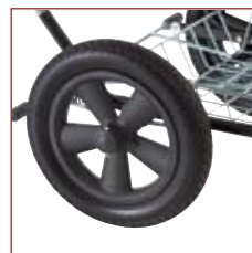
Kunststoffhjul med PUR profil, der ikke er til at slide op.