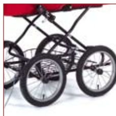
Ego fås også på sammenklappeligt standard stel.