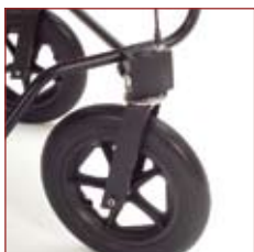
Servostyring gør det let at dreje vognen om hjørnerne.