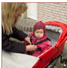
Omega, Ego og Jumbo fås i grå eller rød.