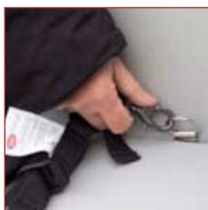
Praktisk placering af selebeslag på alle overdele.