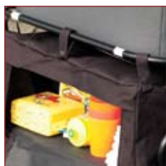
Praktisk vandtæt og rummelig taske med træbund.