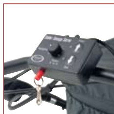
Betjeningspanelet er meget enkelt at betjene.

Til Odder Omega fås en meget nyttig og ergonomisk fodvippe, der kan monteres på stellet. Fodvippen gør det særdeles nemt at vippe vognen over en forhindring med et relativt let tryk med foden. På den måde undgår man at belaste arme og skuldre.