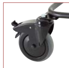
Små solide hjul med bremses gør krybben nem at flytte.