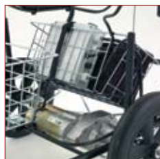
Batteriet tilsluttes blot 220 V for at blive ladet op.