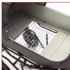
Fodkurv, tilbehør så 4 børn kan sidde front mod front.