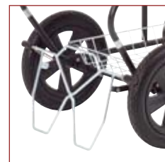
Solid fodbetjent galvaniseret sikkerhedsbremse .