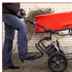
Som ekstraudstyr kan fås ergonomisk fodvippe.