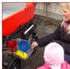
Rummelig udtrækskurv er standard på Omega servo.