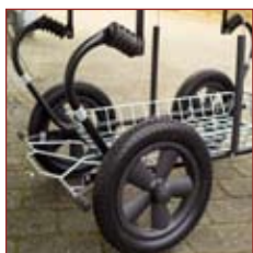
Varekurv er standard på Omega, Ego og Jumbo.