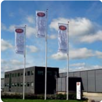
Odder barnevognsfabrik har for nylig gennemgået en større modernisering med opførelse af en ny administrationsbygning, der blev indviet i maj 2007.