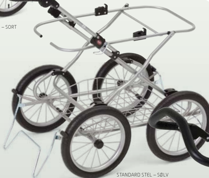
STANDARD STEL - SØLV