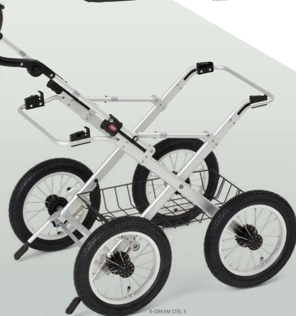
X-DREAM STEL II

CLASSIC Den velkendte klassiske overdel med den fastopspændte kaleche og de stramme rene linjer.