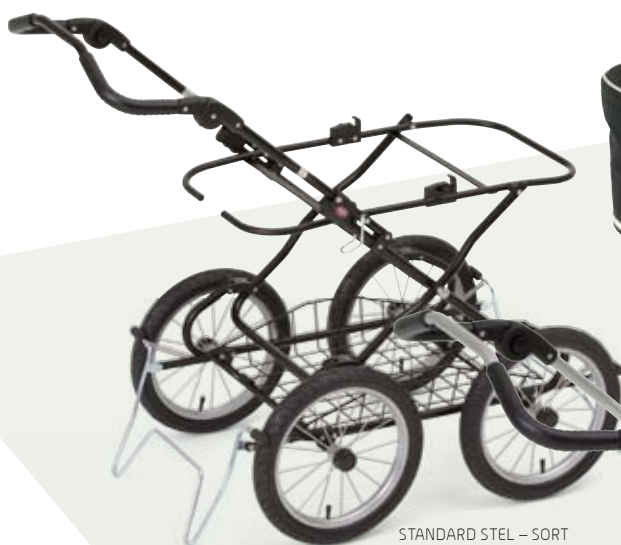
STANDARD STEL - SORT